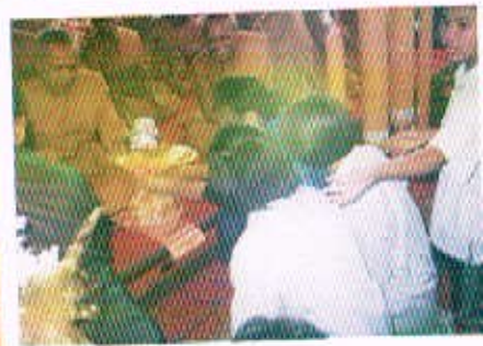
27 ก.ค. 50 กิจกรรมทางกึ่งนันทนาการ