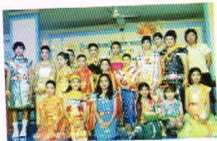
29 พ.ย. 50 กิจกรรมวันลอยกระทง