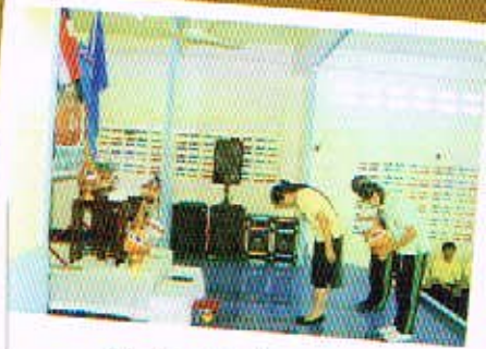
11 ส.ค. 50 กิจกรรมวันแม่แห่งชาติ