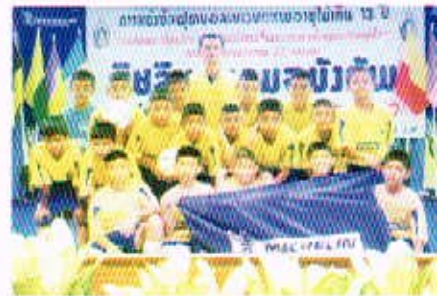
3 ก.ค. 50 กิจกรรมการถ่ายทอดสดโอลิมปิกในคอมพิวเตอร์