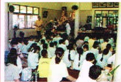
กิจกรรมทำบุญกุศลในวันพระ ณ วัดผาโมฬี