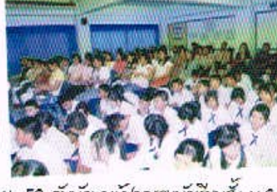
13 พ.ย. 50 วันนัดพบผู้ปกครองนักเรียนชั้น ม.3