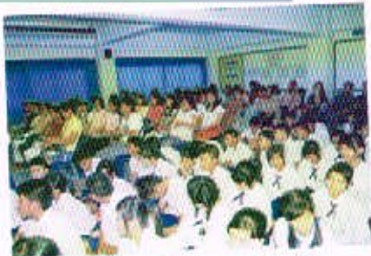
13 พ.ย. 50 วันนัดทบทวนผู้ปกครองนักเรียนชั้น ม.3