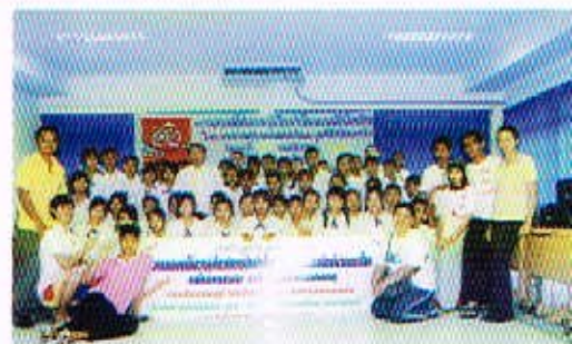
19 พ.ย. 50 การอบรมในสถานพรีกษาภิบาลกับโรดออกสกีในโรงเร