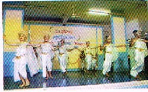
26 มี.ย. 50 กิจกรรมวันสุนทรภู่