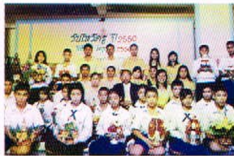
14 มี.ย. 50 กิจกรรมวันในค่าย