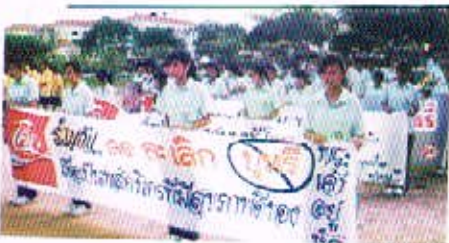
31 พ.ต. 50 กิจกรรมกาถอินทรนรงค์ต่อต้านงาฬพตติด วันงดสูบบุหรี่โลก