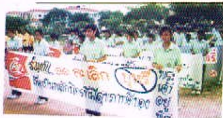
31 พ.ค. 50 กิจกรรมการเดินรณรงค์ต่อต้านยาเสพติด วันงดสูบบุหรี่โลก