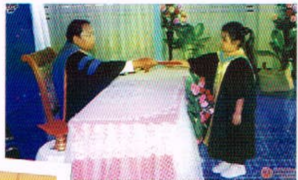
4 มี.ค. 50 กิจกรรมนักกีฬาน้อง