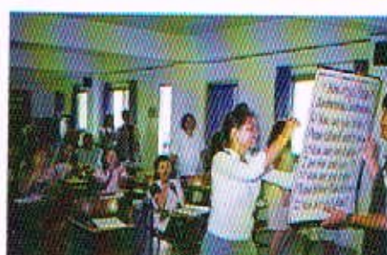
การอบรมทบทวนการจัดการจัดการเรียนการสอน