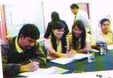
การศึกษาดูงานประกันคุณภาพการศึกษาน โรงเรียนดงพญา