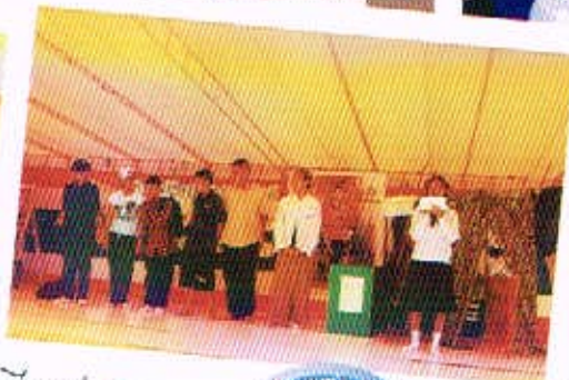
27 ก.ค. 50 กิจกรรมวันกาชาดไทยแห่งชาติ