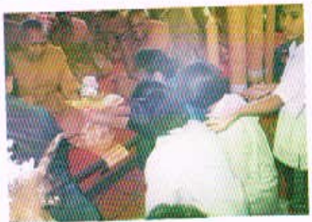
27 ก.ต. 50 กิจกรรมถวายเทียนจำนำพรรษา