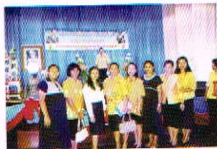
การศึกษาดูงานที่การอ่านสัปดาห์ 30 ส.ค. 50