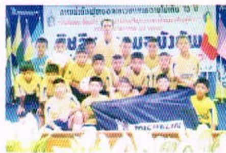
3 ก.ต. 50 กิจกรรมการแข่งกีฬาฟุตบอลมิติดินแดนลพบุรี