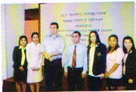
การอบรมทบทวนการจัดการเรียนการสอนภาษาอังกฤษ 8 ส.ค. 50