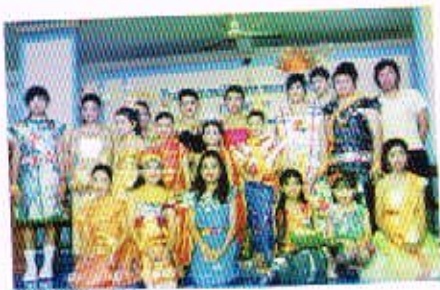
23 พ.ย. 50 กิจกรรมวันลอยกระทง