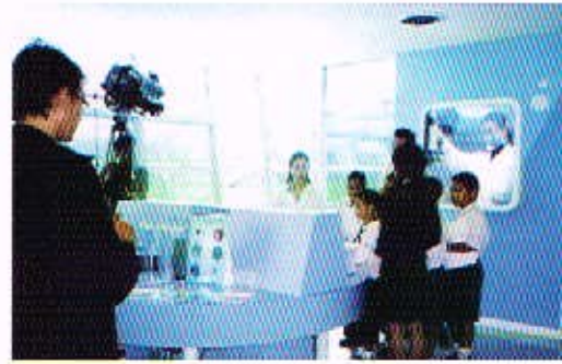
ตัวแทนนักเรียนสมัครกิจกรรมโรดโชว์กับบริษัท สตี