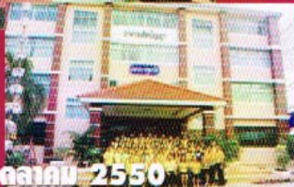
8 ตุลาคม 2550