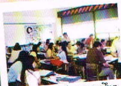
การศึกษาดูงานประกันคุณภาพการศึกษาน โรงเรียนอัมรินทร์วิทยาสัตตนิม